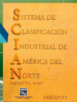
SCIAN México 1997