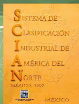
SCIAN México 1997