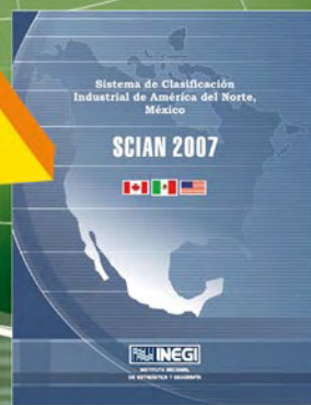
SCIAN México 2007