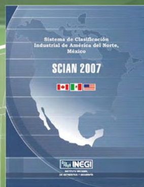
SCIAN México 2007