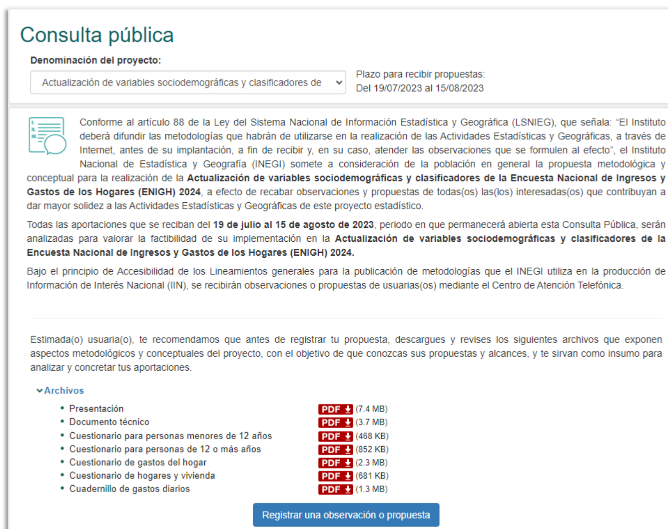
Imagen 1. Sitio del INEGI de la Consulta Pública de la ENIGH