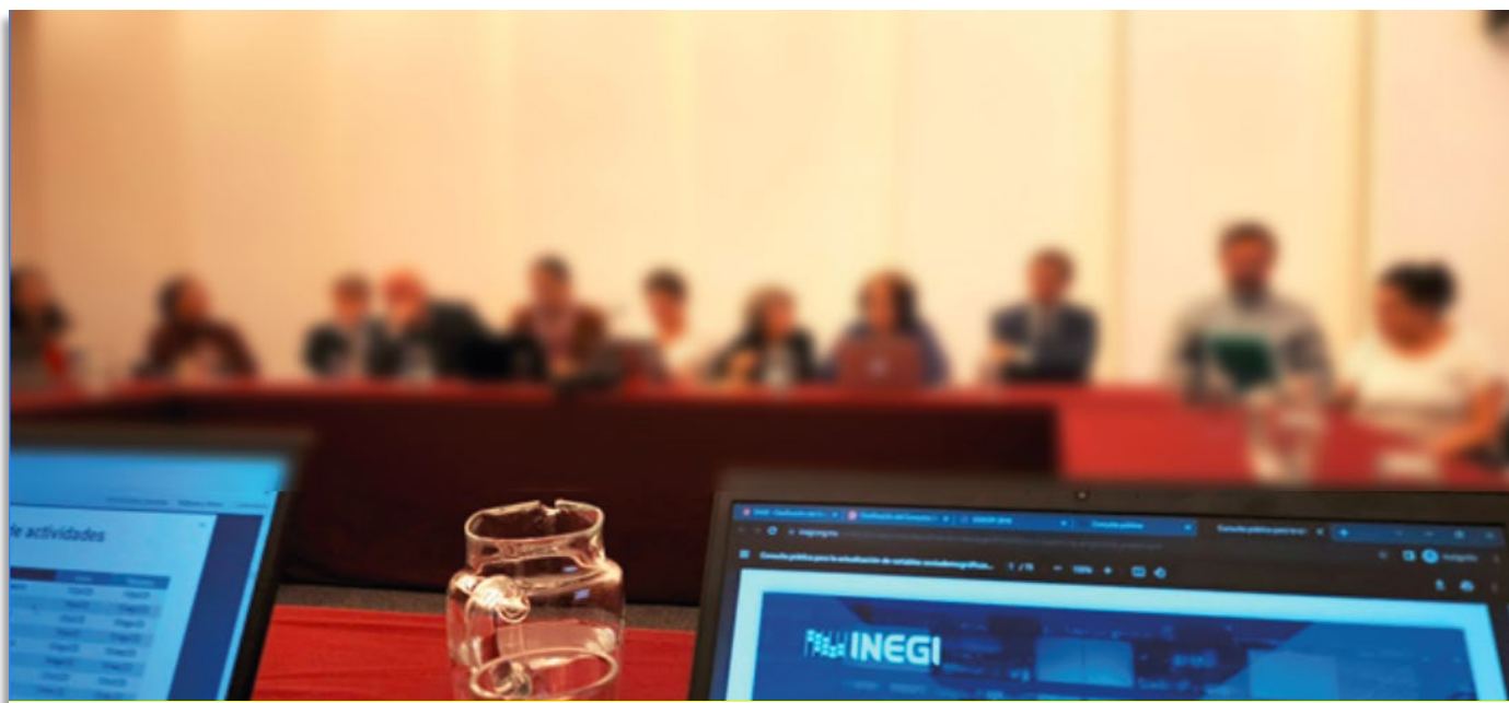
Imagen 4. Reunión en instalaciones de El Colegio de México

Foto tomada en la reunión realizada el 8 de agosto de 2023.