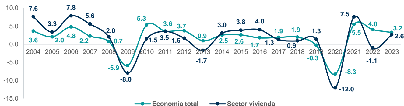
Gráfica 3 Evolución del Producto Interno Bruto (PIB) de la economía total y del sector Vivienda 2004-2023 (variación porcentual anual)

Fuente: INEGI. Cuenta Satélite de Vivienda de México (CSVm), 2023.