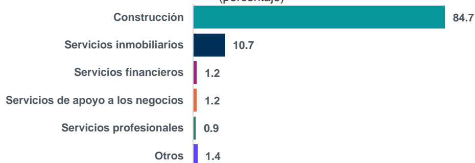
Gráfica 4 Puestos de trabajo de la vivienda, según actividad 2023 (porcentaje)

Nota: La suma de los parciales puede no coincidir con el total debido al redondeo.