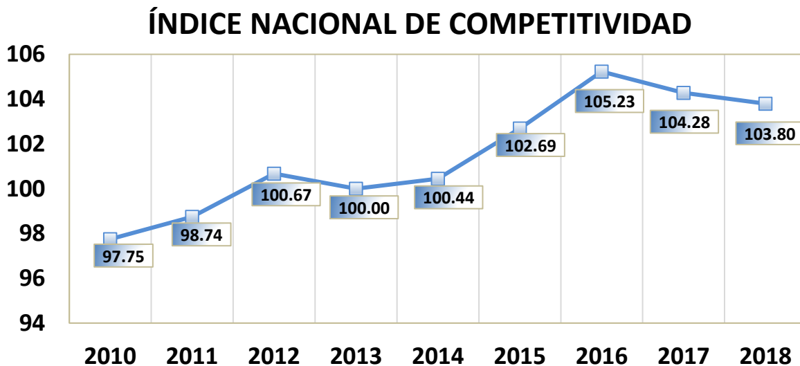
Gráfica 1. Índice Nacional de Competitividad (Año de referencia 2013)

El resultado negativo del INC en 2018, fue influenciado principalmente por tres de los siete componentes: Instituciones que cae 2.45, debido a que se incrementaron las Tasas de homicidios por cada 100 mil habitantes , disminuyó el porcentaje de la población que considera seguro su municipio , aumento el gasto en medidas para prevenir la delincuencia , los delitos con portaciones de armas , ocasionando con ello una caída en los subcomponentes de Seguridad y Eficiencia de Gobierno, este último por un aumento en el costo de registro de propiedades . El componente de Capacidades , cae 2.68 por ciento, ocasionado por una disminución de los subcomponentes de Educación Básica, Educación Avanzada y Salud, la primera influenciado por una disminución del Gasto nacional en educación, como porcentaje del PIB y la Tasa neta de matriculación secundaria . La segunda, por una disminución en la diferencia de la tasa bruta de matriculación en educación superior . La tercera disminuye debido a un aumento en el Número de casos de tensión arterial alta por cada 100 mil