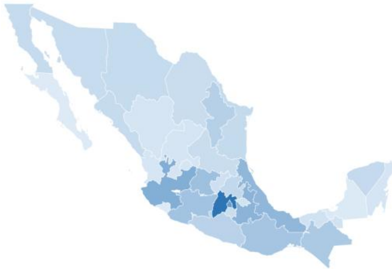
Gráfica 2 UNIDADES ECONÓMICAS POR ENTIDAD FEDERATIVA

A nivel de entidad federativa, el estado de México y Ciudad de México concentran el mayor número de establecimientos en el país. Baja California Sur y Colima son las entidades con menos unidades económicas.