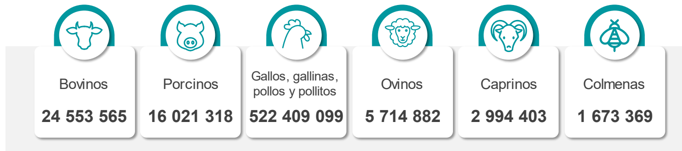
Figura 1 PRODUCCIÓN PECUARIA SEGÚN PRINCIPALES ESPECIES