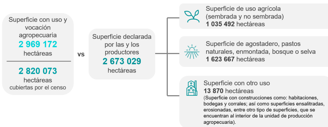
Gráfica 1 SUPERFICIE CON USO Y VOCACIÓN AGROPECUARIA

El Censo Agropecuario revela que, en 2022, en Nuevo León había 43 502 unidades de producción agropecuaria y 1 035 492 hectáreas de superficie agrícola. Las unidades de producción se distribuyeron de la siguiente manera: 27 378 fueron unidades de producción activas 4 , con 643 750 hectáreas de superficie agrícola y 16 124 fueron unidades de producción agropecuaria sin actividad, 5 con 391 742 hectáreas de superficie agrícola.