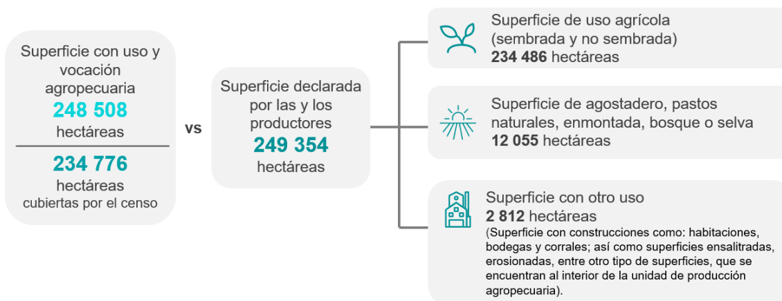
Gráfica 1 SUPERFICIE CON USO Y VOCACIÓN AGROPECUARIA

El Censo Agropecuario revela que, en 2022, en Tlaxcala había 90 528 unidades de producción agropecuaria y 234 486 hectáreas de superficie agrícola. Las unidades de producción se distribuyeron de la siguiente manera: 85 069 fueron unidades de producción activas 4 , con 228 360 hectáreas de superficie agrícola y 5 459 fueron unidades de producción agropecuaria sin actividad, 5 con 6 126 hectáreas de superficie agrícola.