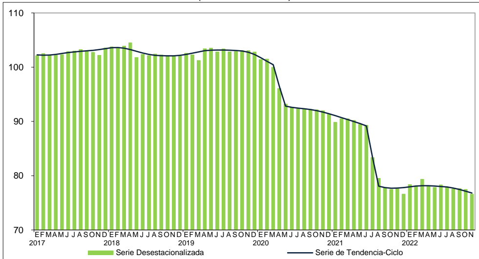
Gráfica 2 ÍNDICE DE PERSONAL OCUPADO TOTAL (Índice 2013=100)