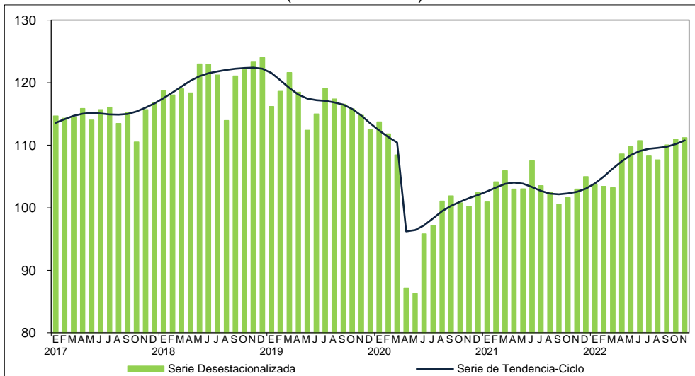
Gráfica 3 ÍNDICE DE GASTOS TOTALES REALES POR CONSUMO DE BIENES Y SERVICIOS (Índice 2013=100)