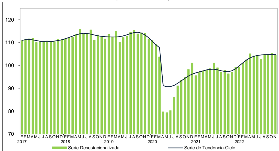
Gráfica 1 ÍNDICE AGREGADO DE LOS INGRESOS TOTALES REALES POR SUMINISTRO DE BIENES Y SERVICIOS (Índice 2013=100)

Las siguientes gráficas muestran las series desestacionalizadas y de tendencia-ciclo de los indicadores de este sector.