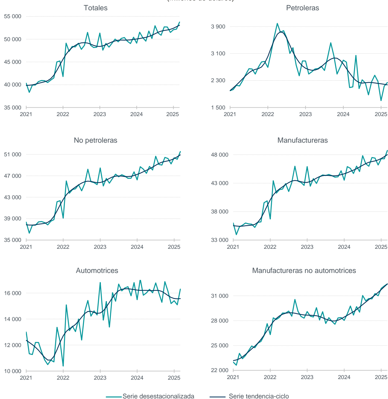
Gráfica 2 Serie desestacionalizada y de tendencia-ciclo de las Exportaciones de mercancías enero de 2021 a marzo de 2025 1/ (millones de dólares)

Nota: Series elaboradas mediante métodos econométricos.