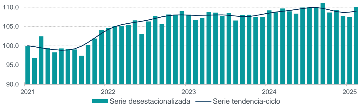
Gráfica 1 Serie desestacionalizada y de tendencia-ciclo del volumen físico de la producción enero de 2021 a febrero de 2025 (índice 2018=100)

Nota: Series elaboradas mediante métodos econométricos.