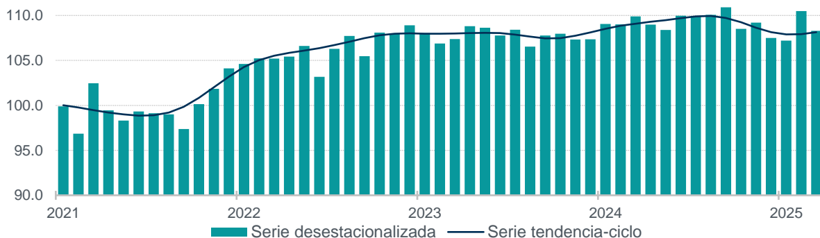
Gráfica 1 Serie desestacionalizada y de tendencia-ciclo del volumen físico de la producción enero de 2021 a marzo de 2025 (índice 2018=100)

Nota: Series elaboradas mediante métodos econométricos.