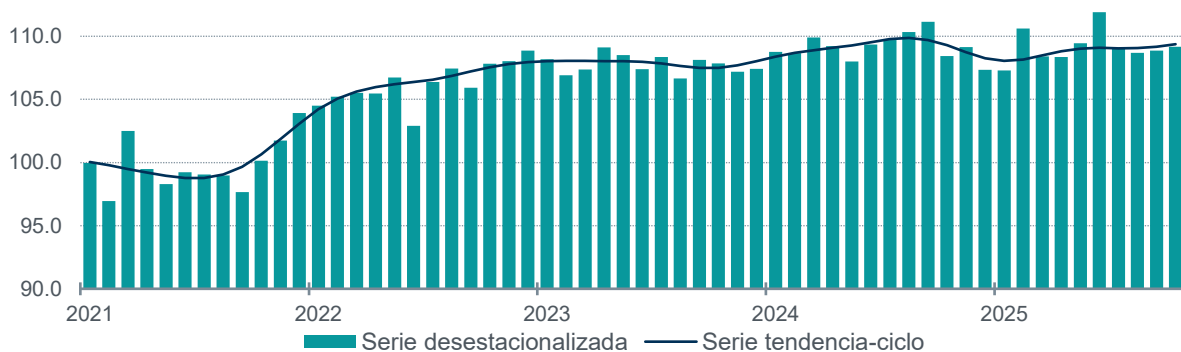
Gráfica 1 Serie desestacionalizada y de tendencia-ciclo del volumen físico de la producción enero de 2021 a octubre de 2025 (índice 2018=100)

Nota: Series elaboradas mediante métodos econométricos.