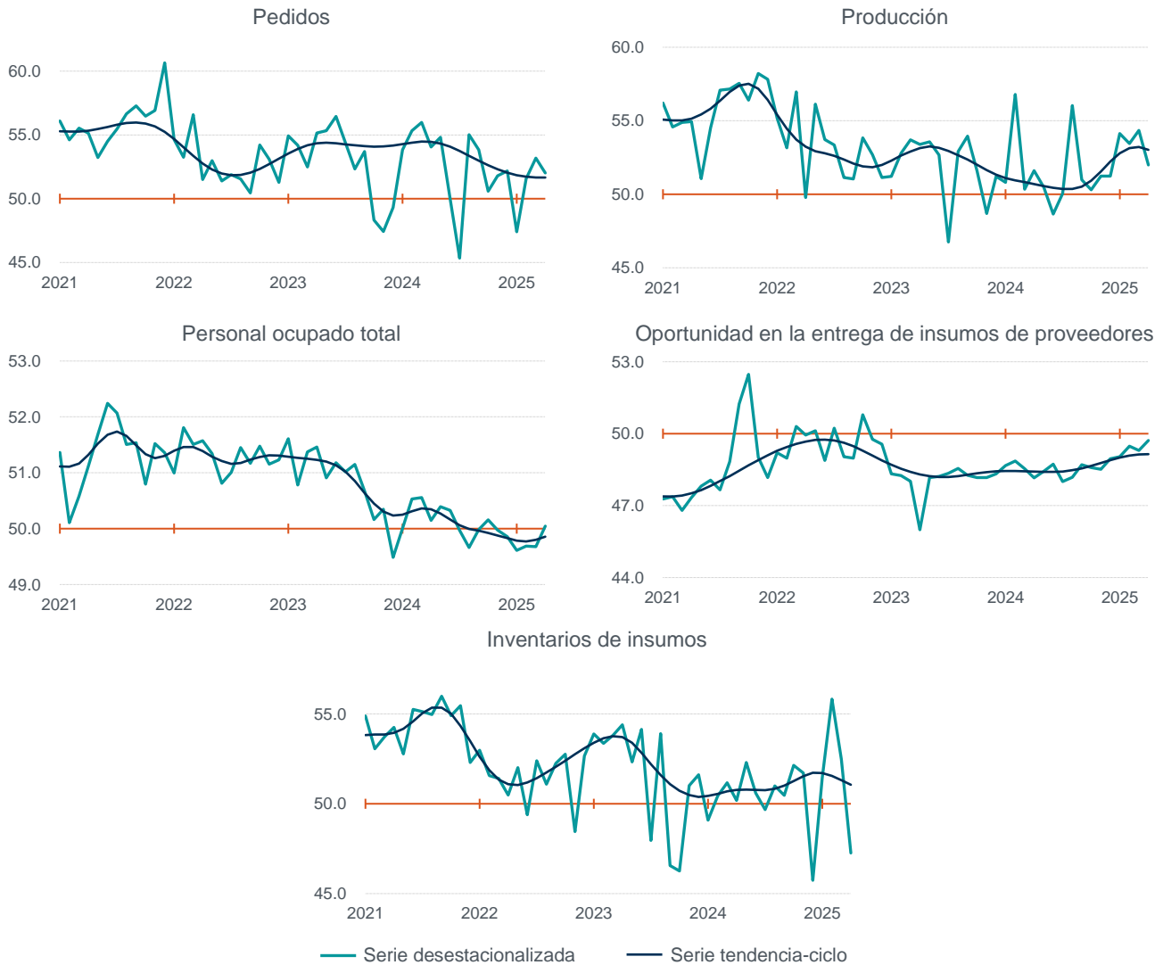
Gráfica 2 Serie desestacionalizada y de tendencia-ciclo de los componentes del Indicador de Pedidos Manufactureros enero de 2021 a abril de 2025 (puntos)