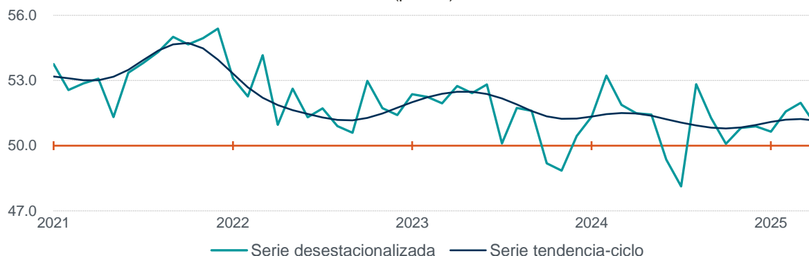
Gráfica 1 Serie desestacionalizada y de tendencia-ciclo del Indicador de Pedidos Manufactureros enero de 2021 a abril de 2025 (puntos)

Nota: Series elaboradas mediante métodos econométricos. Fuente: INEGI y Banco de México. Encuesta Mensual de Opinión Empresarial (EMOE), 2025.