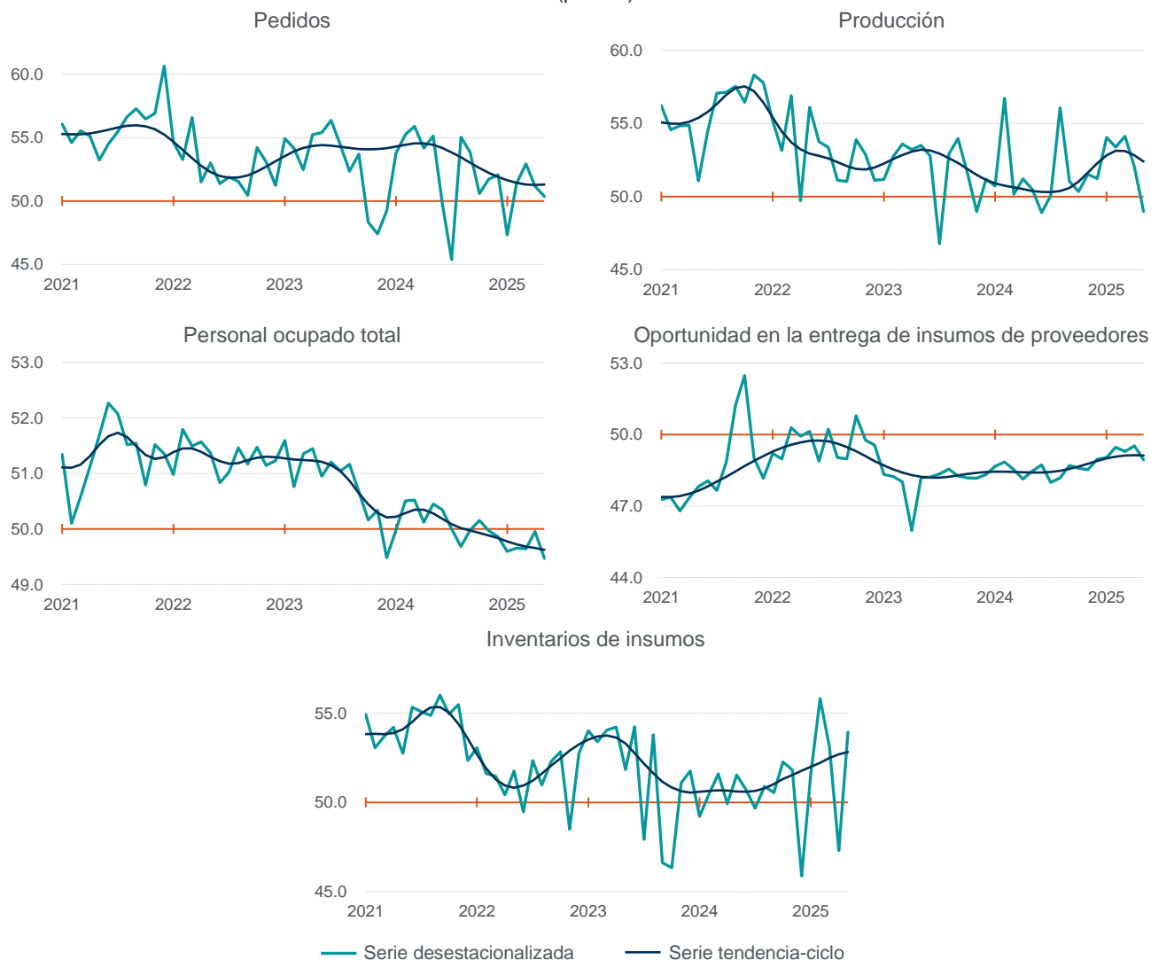
Gráfica 2 Serie desestacionalizada y de tendencia-ciclo de los componentes del Indicador de Pedidos Manufactureros enero de 2021 a mayo de 2025 (puntos)

Nota: Series elaboradas mediante métodos econométricos.