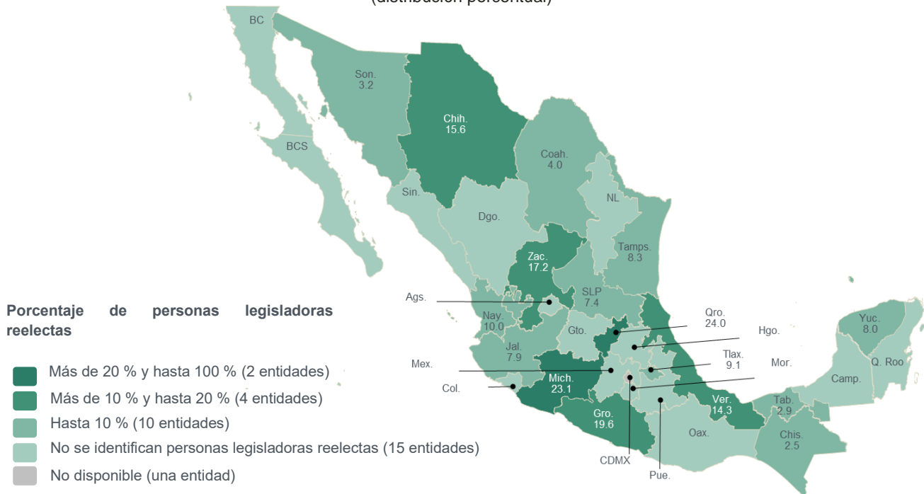
Mapa 1 Personas legisladoras reelectas en los congresos estatales (distribución porcentual)

Nota: El porcentaje se calculó con base en el número de personas legisladoras en activo de cada entidad federativa.