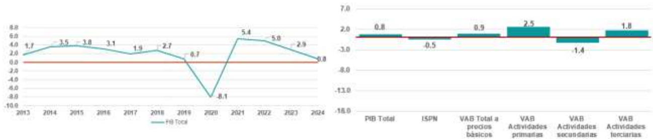
Gráfica 1 Producto Interno Bruto (PIB) de Jalisco 2013-2024 (variación porcentual anual)

Durante 2024, el Producto Interno Bruto (PIB) de Jalisco registró una variación a tasa anual de 0.8 por ciento. El Valor Agregado Bruto (VAB) de las actividades primarias reportó un crecimiento anual de 2.5 %; el de las secundarias disminuyó 1.4 % y el de las terciarias, aumentó 1.8 por ciento. Los Impuestos sobre los productos, netos (ISPN) para el total de la economía de la entidad descendieron 0.5 % (ver gráfica 1).