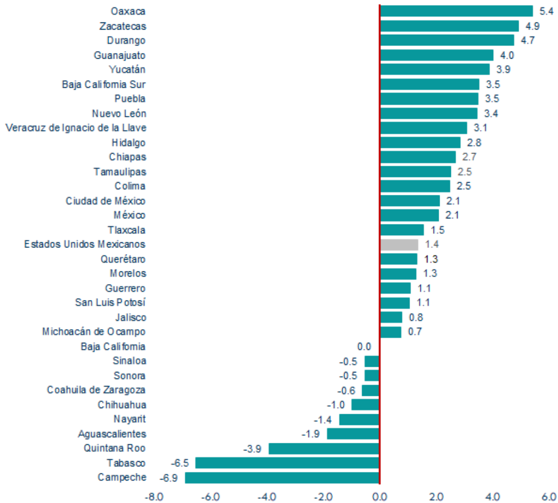
Gráfica 2 Variación anual del Producto Interno Bruto, según entidad federativa 2024 (porcentaje)