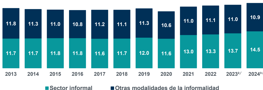
Gráfica 1 Contribución del Valor Agregado Bruto de los componentes de la economía informal en el Producto Interno Bruto 1/ 2013-2024 (porcentaje)

1/ La suma de los porcentajes puede no coincidir con los totales debido al redondeo de cifras.