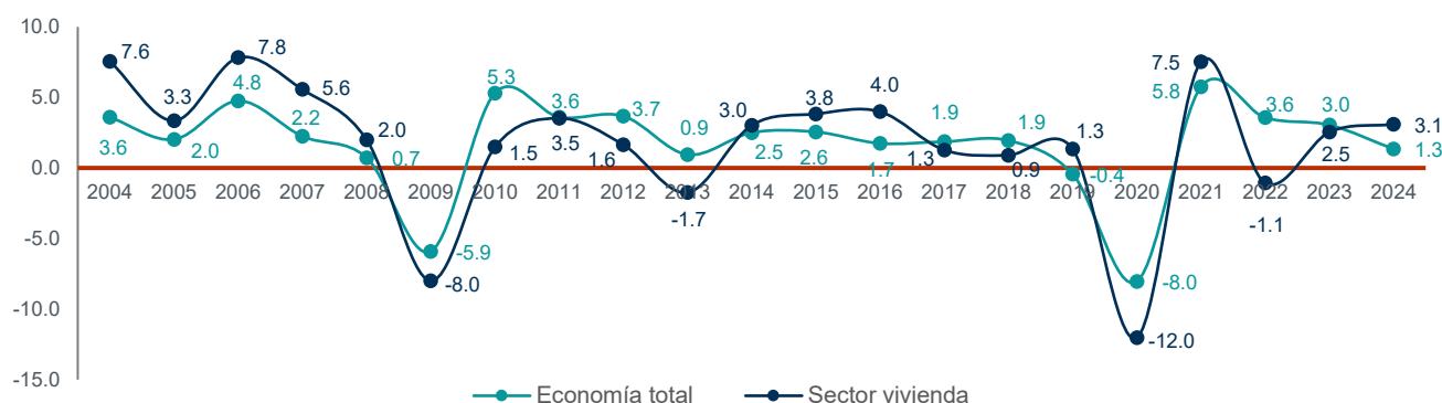
Gráfica 1 Evolución del Producto Interno Bruto de la economía total y del sector de la vivienda 2003-2024 (porcentaje)

Fuente: INEGI. Cuenta Satélite de Vivienda de México (CSVm), 2024.