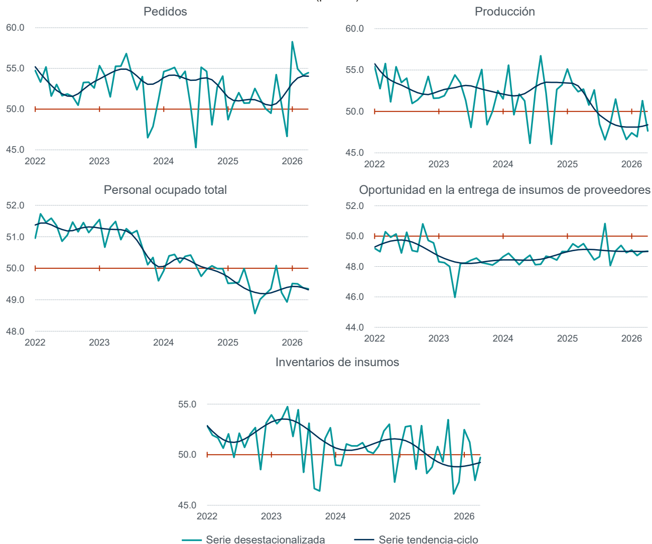
Gráfica 2 Serie desestacionalizada y de tendencia-ciclo de los componentes del Indicador de Pedidos Manufactureros enero de 2022–abril de 2026 (puntos)