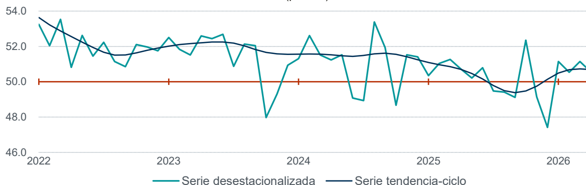
Gráfica 1 Serie desestacionalizada y de tendencia-ciclo del Indicador de Pedidos Manufactureros enero de 2022–abril de 2026 (puntos)

Nota: Series elaboradas mediante métodos econométricos.