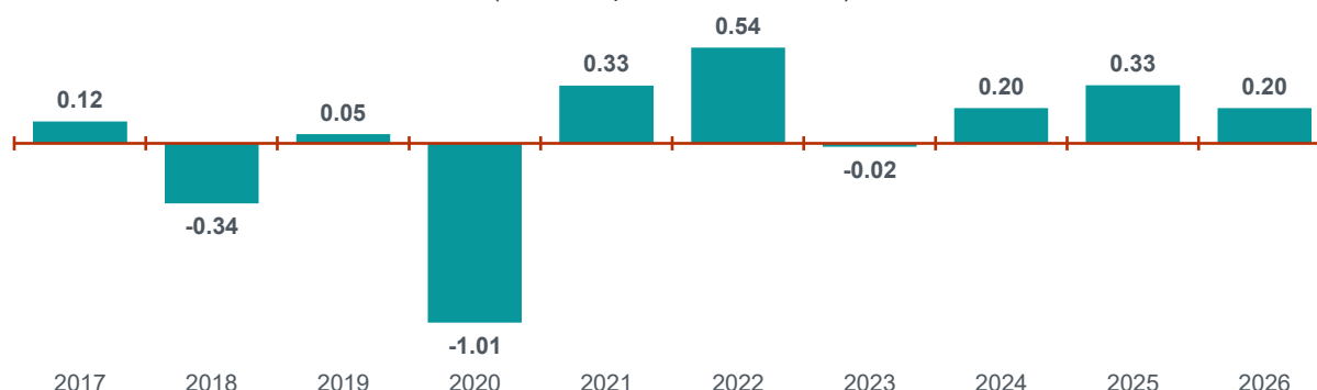
Gráfica 1 Variación del Índice Nacional de Precios al Consumidor abril de los años que se indican (variación porcentual mensual)