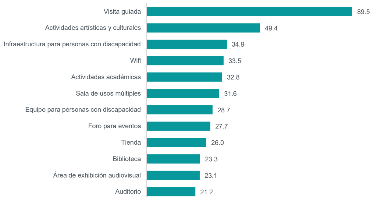
Gráfica 1 Museos, según principales servicios que ofrecen 2025 (porcentaje)