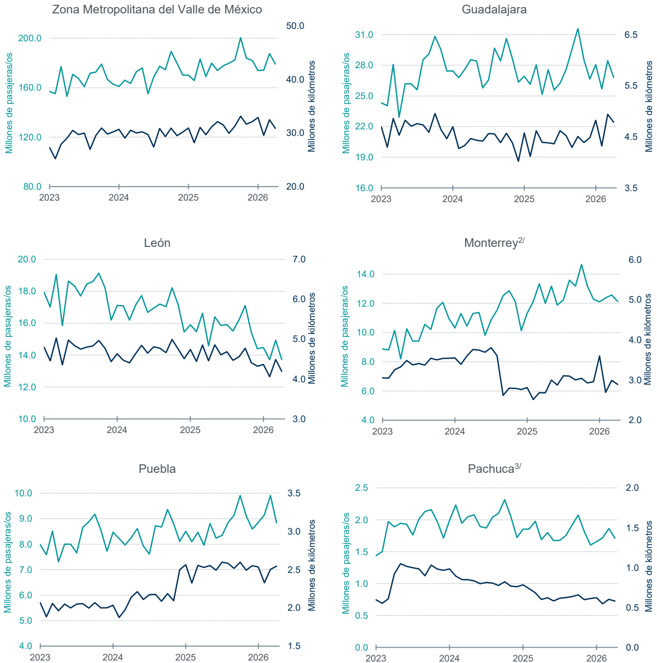
Gráfica 1 Pasajeros/os transportados y distancia recorrida por los sistemas de transporte urbano, según ciudad enero de 2023–abril de 2026 1/ (millones de pasajeras/os y de kilómetros)